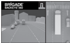
Geteilte Rückansicht und 360° Ansicht