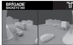
Vorderansicht für kreuzenden Verkehr