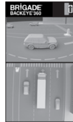
Geteilte linke Ansicht und 360° Ansicht